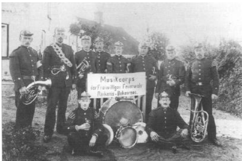
Rinkenæs Brandværsorkester får nye uniformer i den gamle stil som brugtes omkring århundredeskiftet.