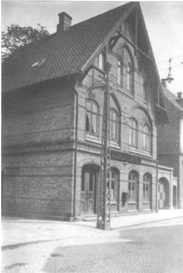
Nygade 15 i 1920.