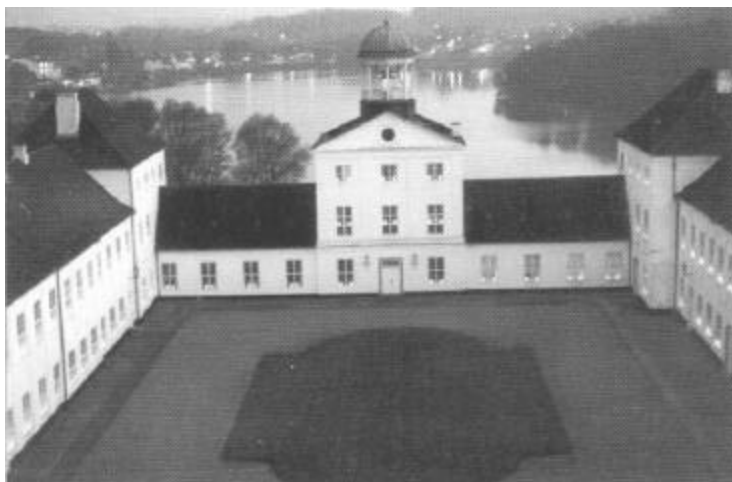
Gråsten Slot 4. maj 1995.

På befrielsesaften den 4. maj tog inspektør S. Gülck fra toppen af Gråsten brandværns store stige dette enestående foto af slottet med lys i alle vinduer.