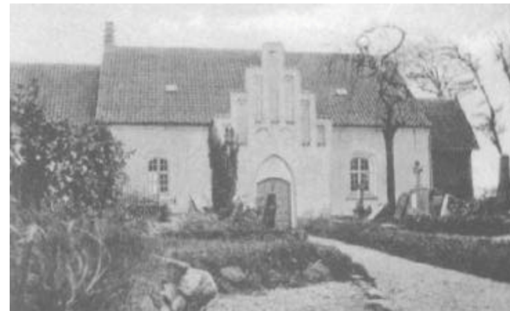
Adsbøl kirke set fra nord.

Adsbøl kirke står overfor en gennemgribende istandsættelse; sidste større renovering fandt sted i 1925 - 26. Nu er der konstateret alvorlige revner i murværket og dermed store fugtproblemer. Tiden vil vise, om det evt. vil kunne lykkes at få dele af det gamle