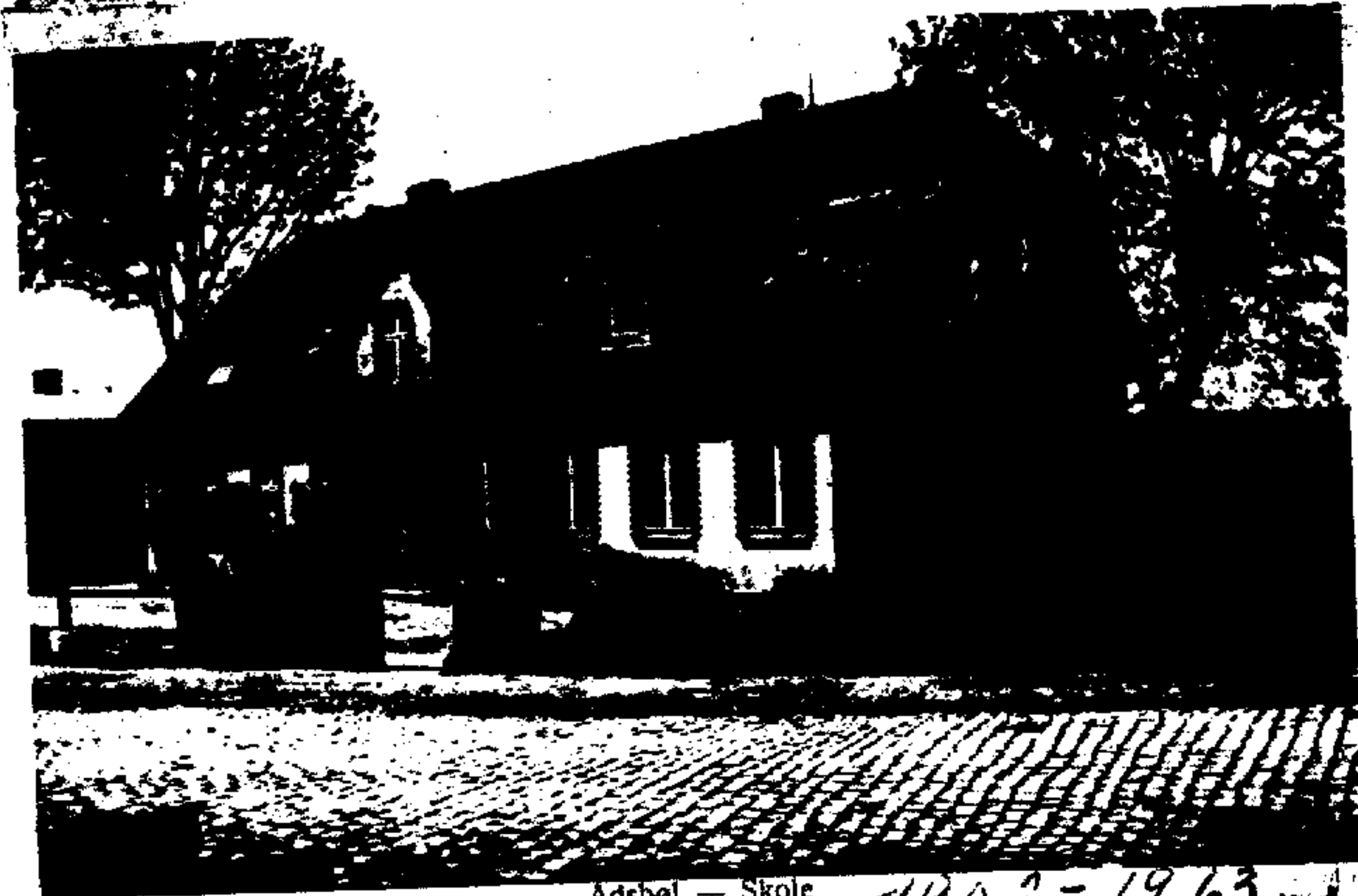
Adsbøl - Skole 1902-1963

Hele den nye skole fra 1940 blev solgt til "Fodiak", en fabrik, der laver Biltelefoner