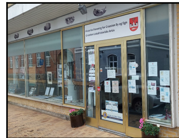
Gråsten Lokalhistoriske Arkiv på Nygade 14, Gråsten