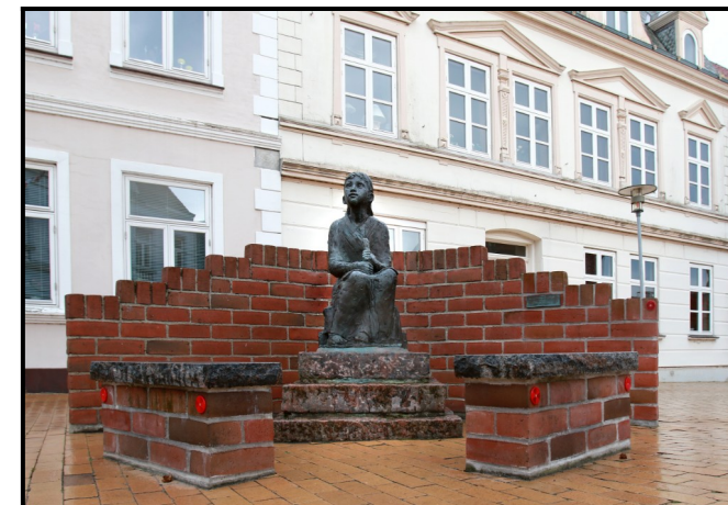
Den lille pige med svovlstikkerne © Jytte Thompson